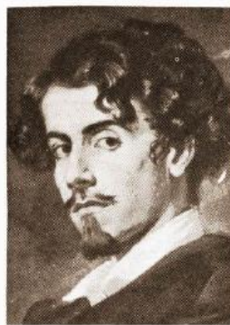
Gustavo Adolfo Bécquer (1836-1870)

Realizar la guía de lectura correspondiente a la lectura obligatoria del curso: Historia de dos ciudades de Charles Dickens. Dicha guía se encuentra recogida en las páginas 173-177 del mismo libro.